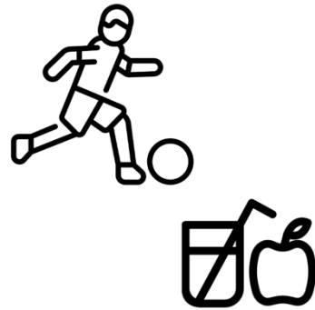
Prendre un goûter, s'amuser