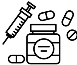
Acheter des médicaments