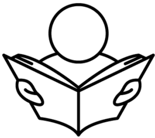
Lire et emprunter des livres