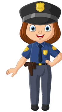
Policier / Policière