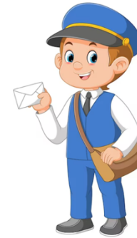
Facteur / Factrice