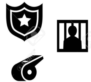
Protéger, faire respecter la loi