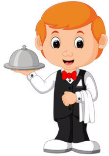
Serveur / Serveuse