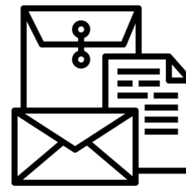
Recevoir ou envoyer du courrier (lettres, colis)